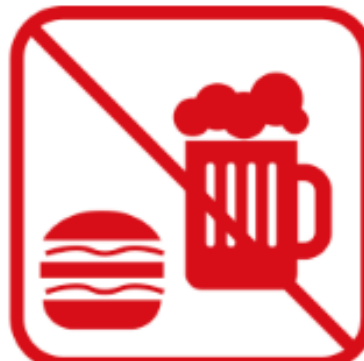
食事・アルコールの 持ち込み