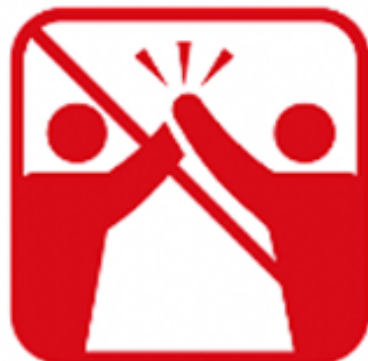
ハイタッチ、肩組み、 握手、抱擁