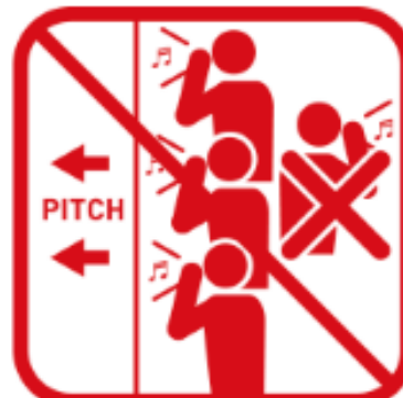
ピッチ方向以外を 向いての声出し